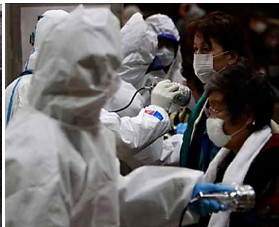
Hiroshima 1945 (links), Fukushima 2011 (rechts)