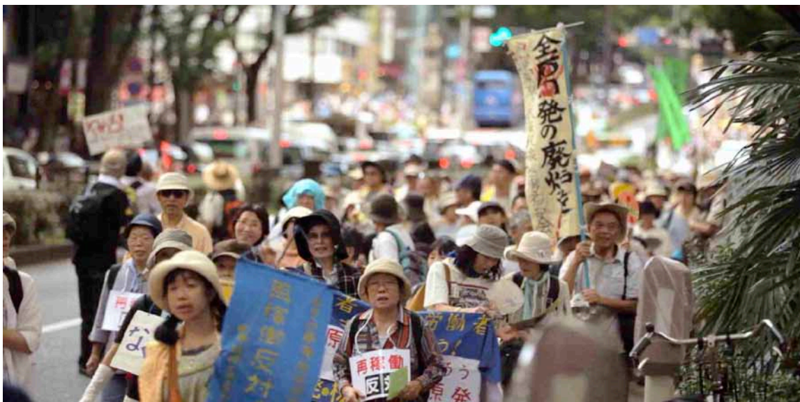
Demonstration gegen die Wiederaufschaltung der AKW's, Tokyo 2012

Was Shuntaro Hida bereits vor dem Reaktorunfall von Fukushima gesagt hat, wirkt aus der heutigen Sicht geradezu prophetisch: "Bezüglich der Abschaffung von nuklearen Waffen sagen gewisse Leute: Nie wieder Hiroshima und Nagasaki. Ich finde das altmodisch. Die nukleare Technologie ist viel weiter gegangen als das. Die Zukunft wird viel schwieriger werden. Das will ich denen sagen. Die Welt könnte sehr furchteinflössend werden und es wird viel schwieriger werden, auf dieser Erde zu leben. Auch wenn gewisse Leute mir sagen, ich sei altmodisch, werde ich auf die gleiche Weise weiterkämpfen wie bisher. Unermüdlich und so lange, bis ich sterbe."